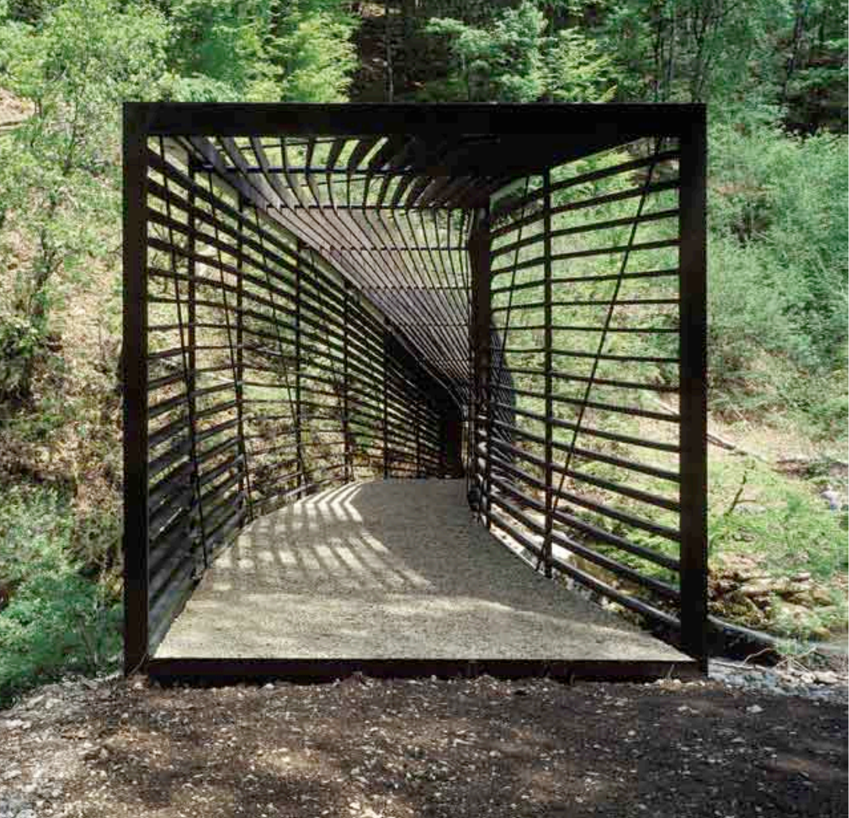
Thomas Jantscher Architekturfotografie 2003